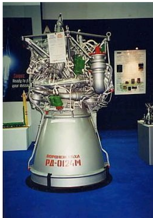
Однокамерный двигатель РД-0124М

Интерес к этим двигателям проявило французское космическое агентство CNES, рассматривающее перспективные носители. Для верхней ступени французам нужен ЖРД тягой примерно 15 тс. КБХА может дать и «четвертушку» РД-0124 (одна камера и турбонасосный агрегат) с тягой примерно 7 тс.