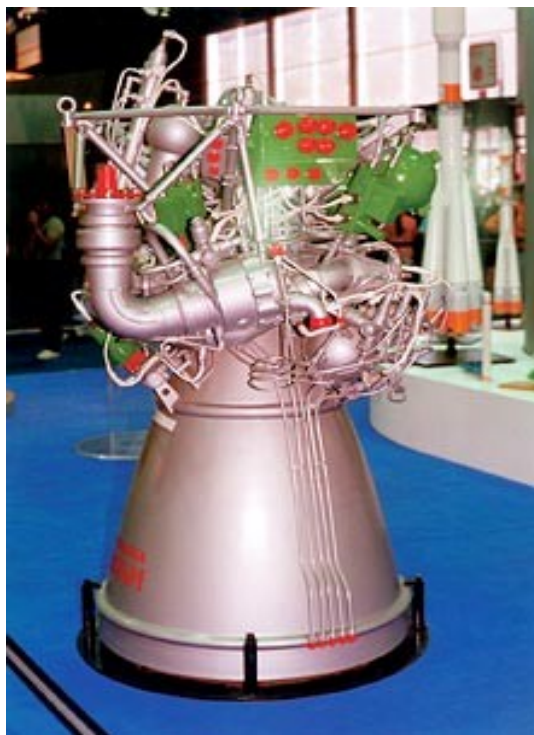
Однокамерный двигатель РД-0124М для «Руси»