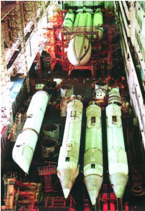
Блок первой ступени ракеты-носителя "Энергия" в сборочном цехе