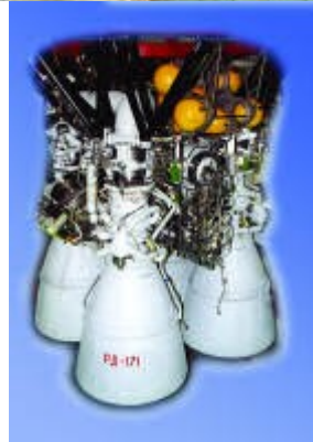
Подготовка к пуску ракеты-носителя "Зенит" (вверху) Двигатель РД-171 в первой ступени РН "Зенит-2" для программы "Морской старт" (внизу)